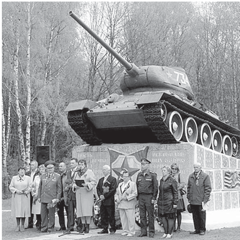
Митинг на Сычёвском «Поле памяти» 8.05.2014 г.