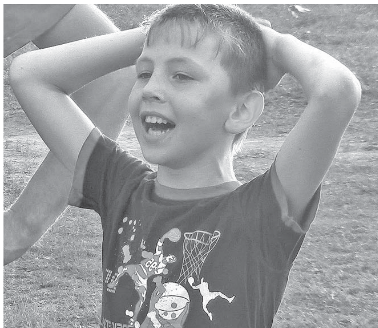
Участники эстафеты получили в награду сладкие призы.